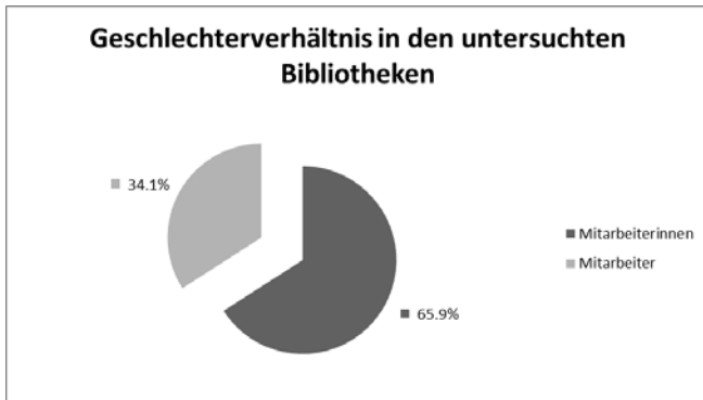
Abb.1: Allgemeines Geschlechterverhältnis in den untersuchten Bibliotheken