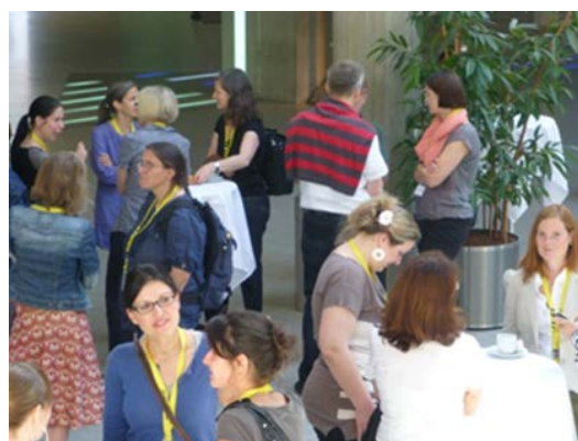
TeilnehmerInnen im Gespräch

Das Thema stiess auf grosses Interesse: rund 65 Teilnehmende fanden sich am letzten Freitag zum gemeinsamen 'Updating' ihres Knowhows und zu angeregten Gesprächen beim Willkommenskaffee und beim Stehlunch über Mittag zusammen.